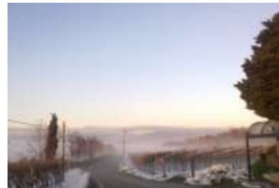
...le quattro stagioni ... Bellissimi le passeggiate dei dintorni ... die 'Vier' Jahreszeiten... herrliche Spaziergänge rund ums Dorf