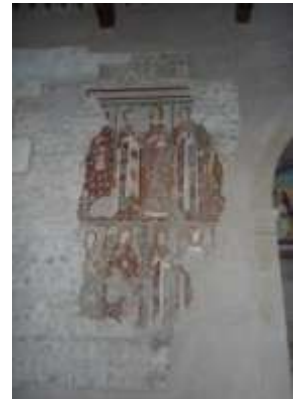
... la Storia e la cultura ... Geschichte und Kultur ...