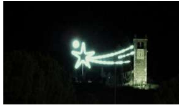
...l'atmosfera particolare ... Atmosphäre in besonderen Momenten