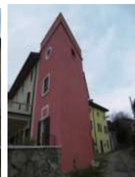
Il paese di Palazzolo .... das Dorf Palazzolo