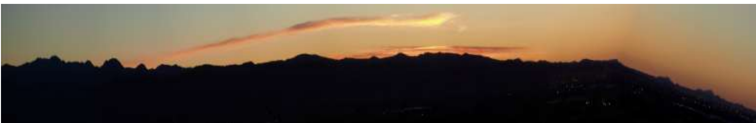
... certe albe ... manche Sonnenaufgänge ...